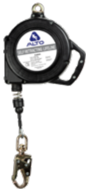
A/RIS-M 50ft A/RIS 50ft (sin mosqueton)

Cable de acero inoxidable Gancho chico aluminio Caja termoplástica Anclaje giratorio