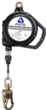
A/RGS-M 20ft A/RGS 20ft (sin mosqueton)

Cable de acero galvanizado Gancho chico aluminio Caja termoplástica Anclaje giratorio