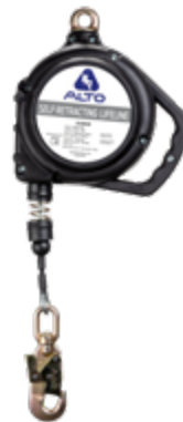
A/RGS 6mt A/RGS 6mt (sin mosqueton)

Cable de acero galvanizado Gancho chico acero Caja termoplástica Anclaje giratorio