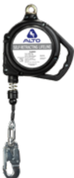
A/RGSA-M 20ft A/RGSA 20ft (sin mosqueton)

Cable de acero galvanizado Gancho chico acero Caja termoplástica Anclaje giratorio