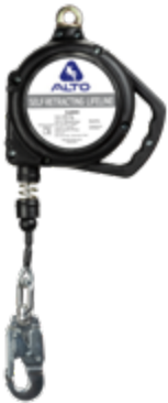
A/RISA-M 30ft A/RISA 30ft (sin mosqueton)

Cable de acero inoxidable Gancho chico acero Caja termoplástica Anclaje giratorio