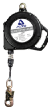
A/RIS-M 15mt A/RIS 15mt (sin mosqueton)

Cable de acero inoxidable Gancho chico acero Caja termoplástica Anclaje giratorio